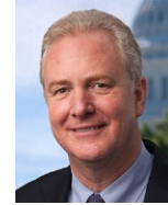
Sen. Van Hollen